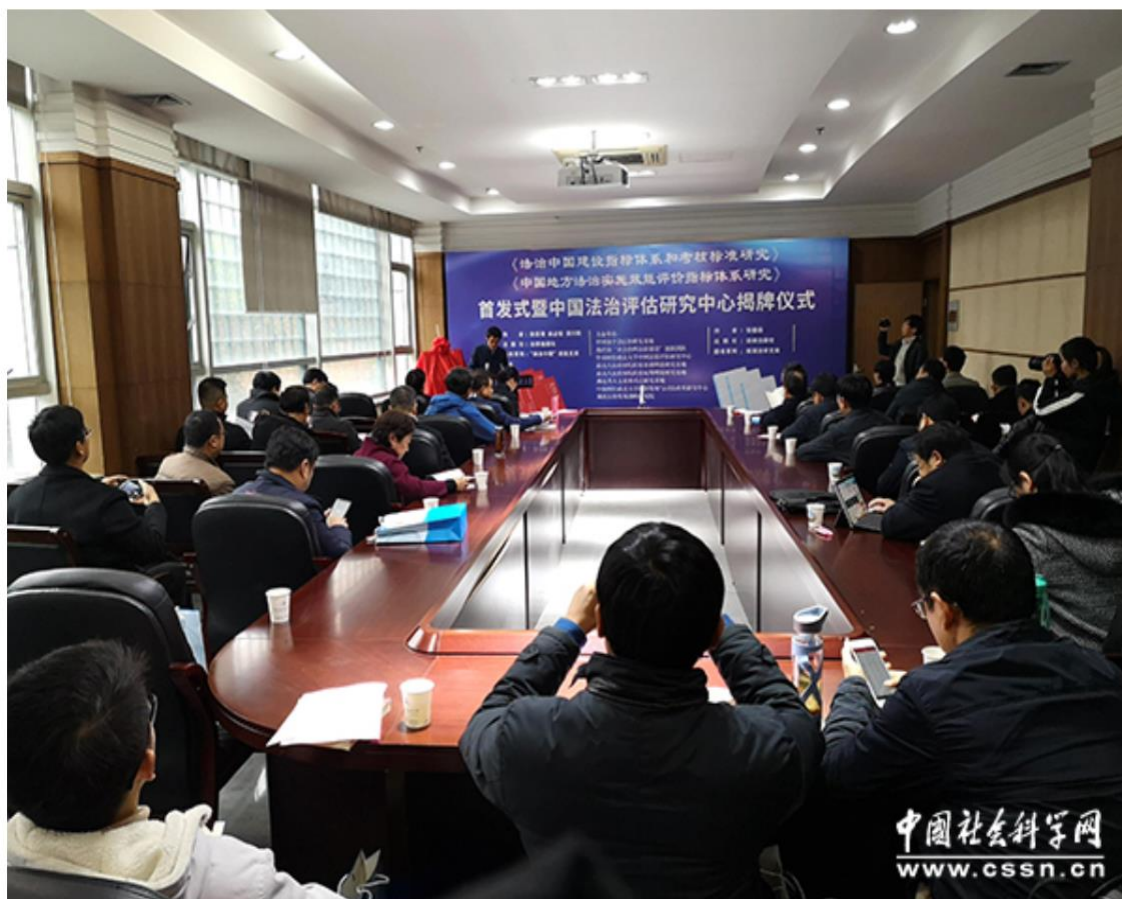
新书首发式暨中国法治评估研究中心揭牌仪式在中南财经政法大学举行