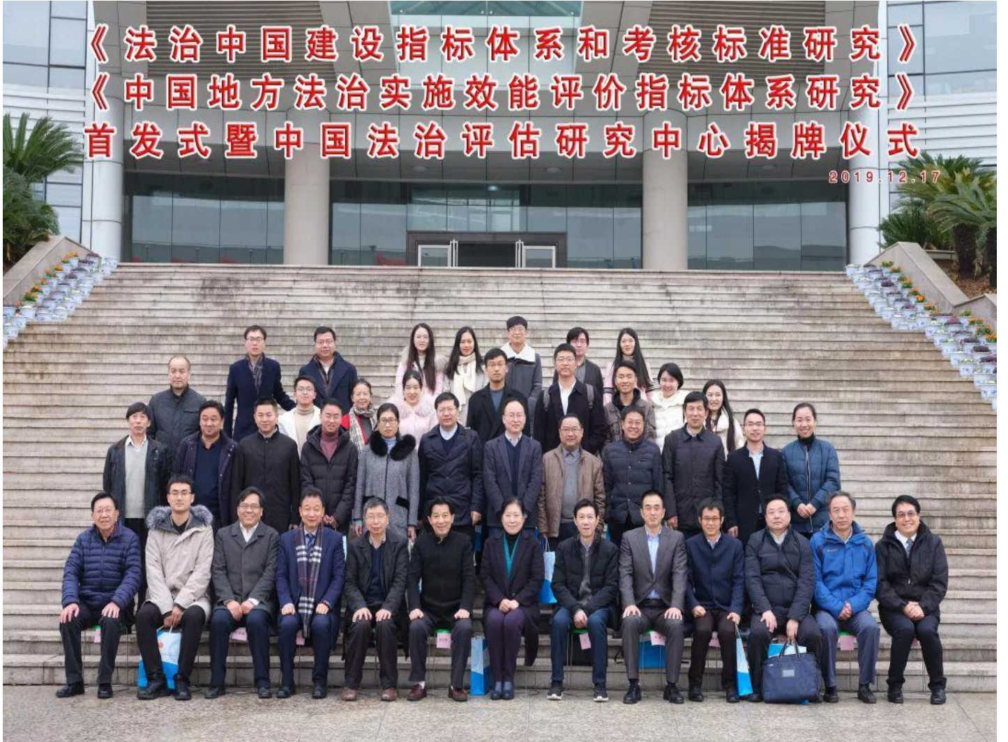
首发式暨中国法治评估研究中心揭牌仪式