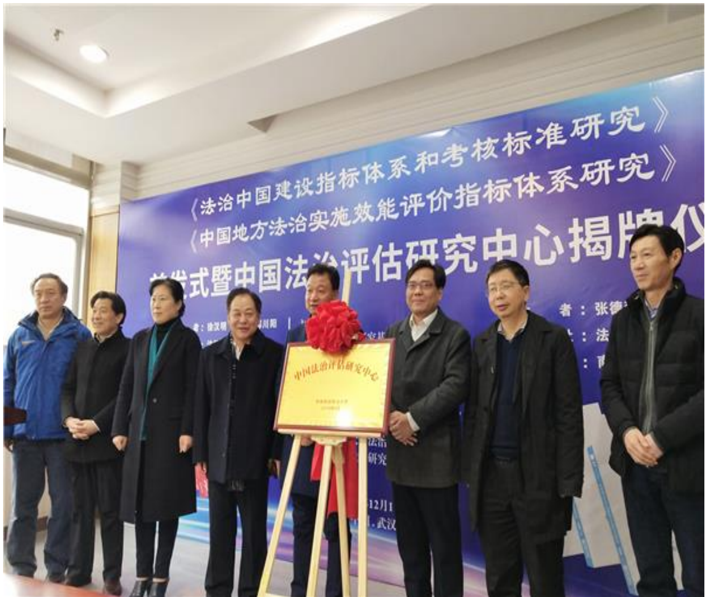
中国法治评估研究中心揭牌仪式