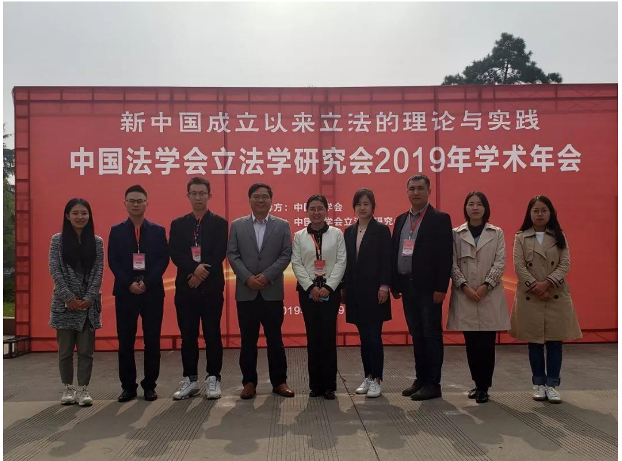
张德森教授及其团队参与中国法学会立法学研究会