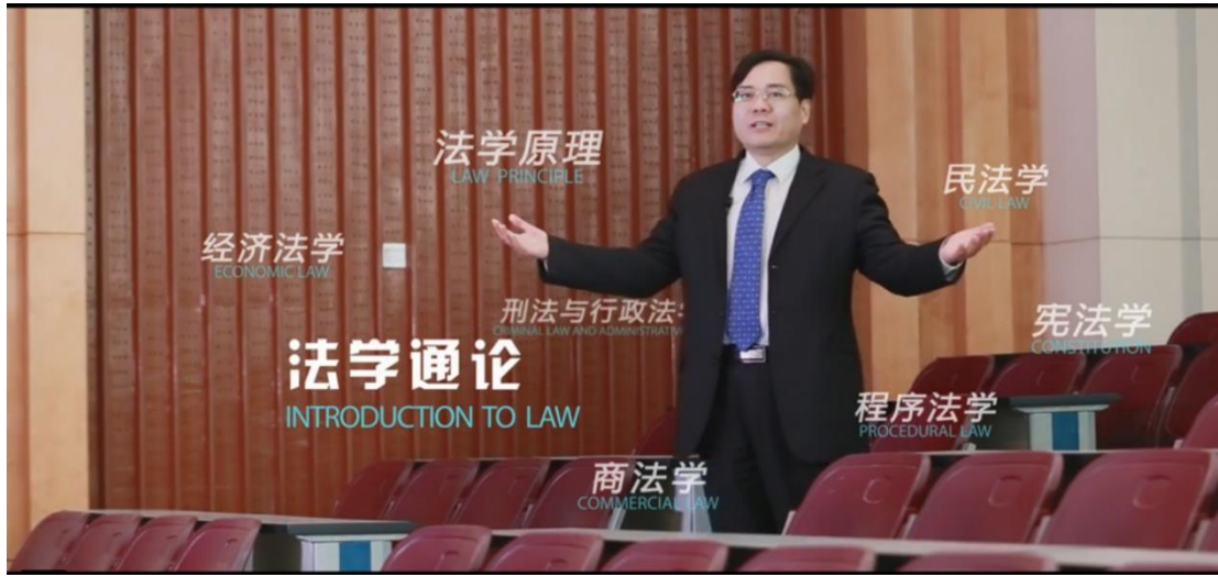
MOOC 中张德森教授讲授法学通论相关课程