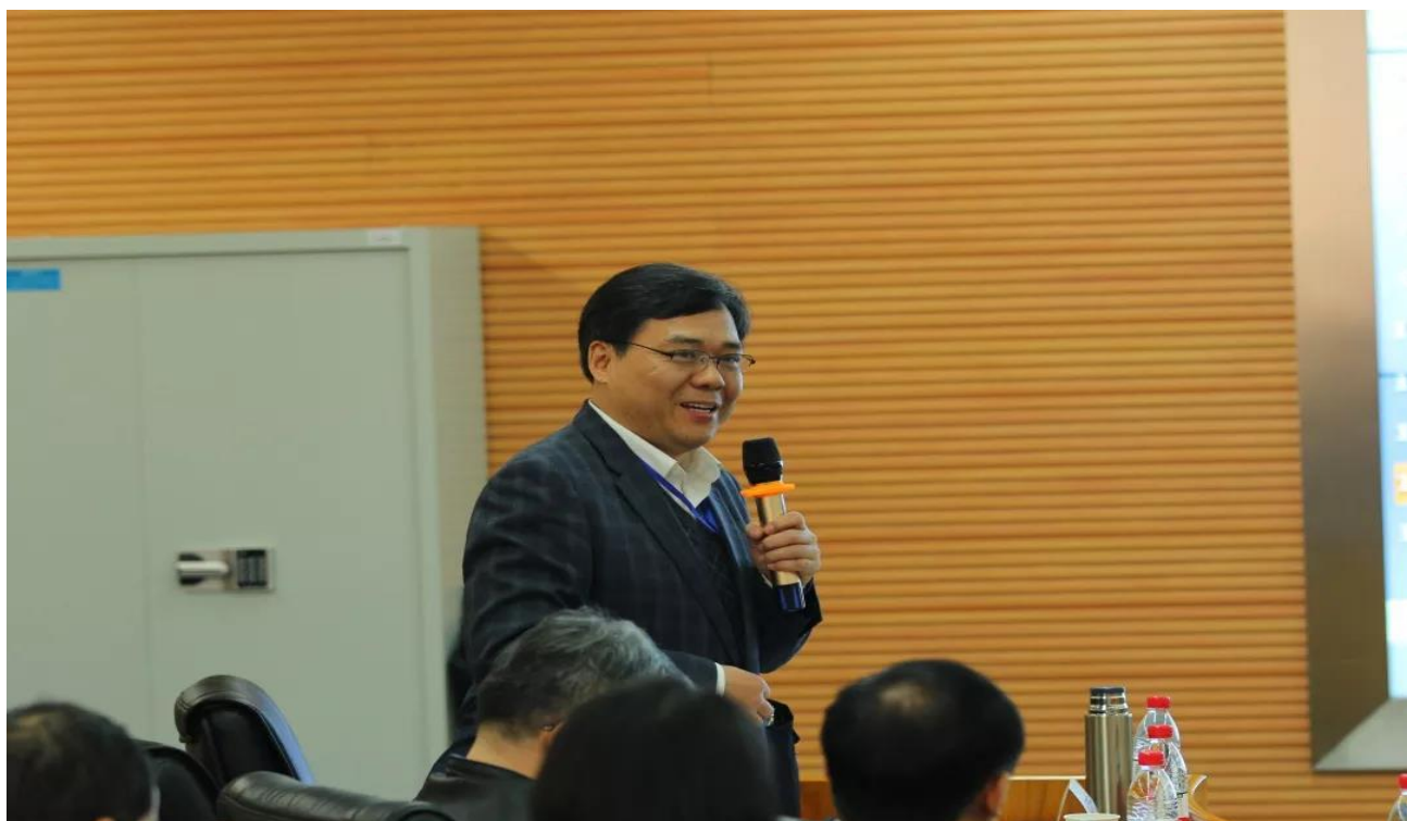
张德森教授报告《网络社会治理法治评估指标体系的研究》